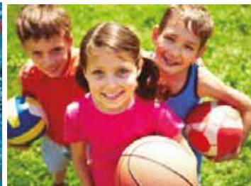
Casal de verano